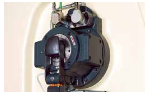
Changement de course rapide, pour plus de flexibilité.

Le changement de course permet de régler rapidement et en toute sécurité les diverses hauteurs de course, ce qui garantit une flexibilité élevée et des applications très variées de la presse. La phase de l'amenage est automatiquement synchronisée sans réglage complémentaire.