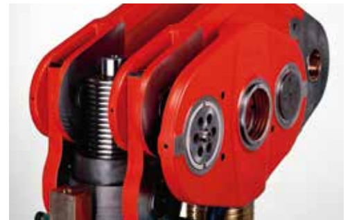
Réglage du coulisseau alors que la presse est embrayée en production.

Grâce au système unique de guidage du coulisseau, les vis trempées et rectifiées n'absorbent chacune que 20% de la charge totale. Cette conception permet de régler la hauteur du coulisseau durant le process de découpe et de maintenir ainsi la position du point mort bas dans un intervalle de tolérance serré tout au long du processus.