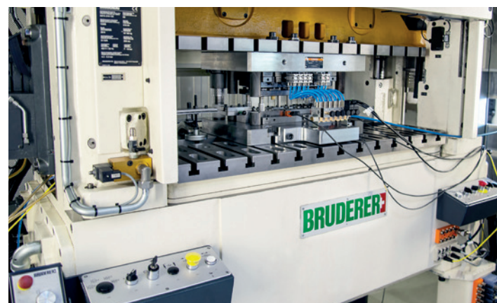
Des process et des structures organisationnelles standardisés pour un succès mondial.