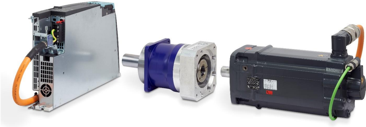
Bildlegende 2: BRUDERER Servoachse BSA bestehend aus Servo-Antriebsmotor, Getriebeübersetzung und Servo-Umrichter.