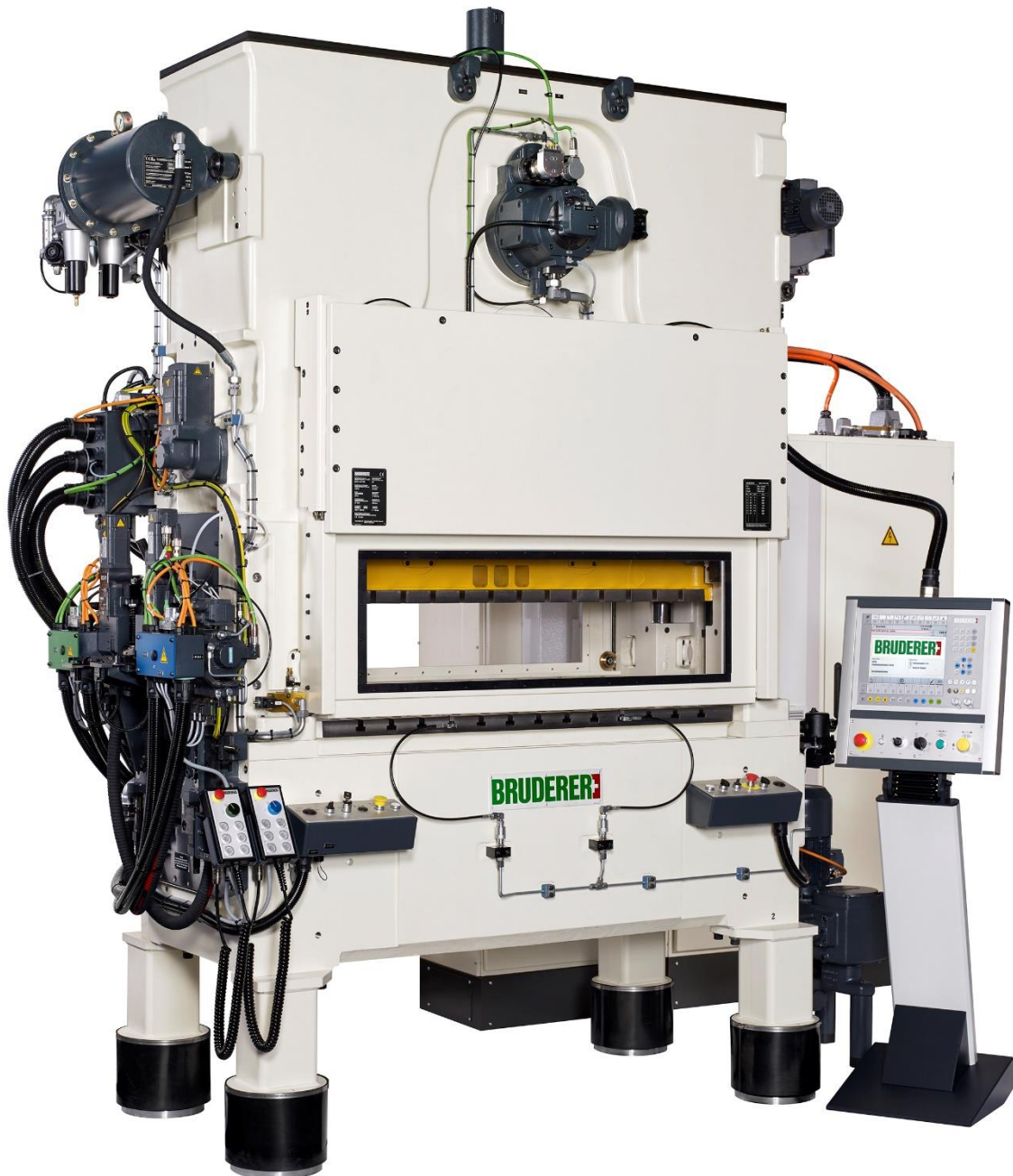
Bildlegende 1: BRUDERER Hochleistungs-Stanzautomat BSTA 510-150 B2 mit BRUDERER Servovorschub BSV 75D