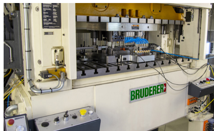
标准化流程和组织架构，助力全球布局工厂的成功。

霍夫曼仍然忠于其“精密领域的专业”的公司口号。凭借他们对BRUDERER的高性能精密冲压机信赖，还有谁不认可？