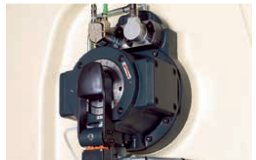
Schneller Hubwechsel für mehr Flexibilität.