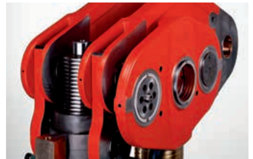
Stösselverstellung während des Laufs unter Produktionsbedingungen.

Der Hubwechsel ermöglicht das schnelle und sichere Einstellen von verschiedenen Hubhöhen. So sind hohe Flexibilität und vielseitiger Einsatz garantiert. Ohne zusätzliche Eingriffe wird dabei die Vorschubphase des Bandvorschubes synchronisiert.