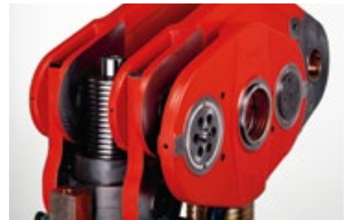
Regulación del carro durante la marcha bajo condiciones de producción.

El cambio de carrera facilita una rápida y segura regulación de diferentes alturas de carreras, garantizando una elevada flexibilidad y versatilidad de empleo. La sincronización con el alimentador de banda se realiza automáticamente sin necesidad de otras intervenciones.