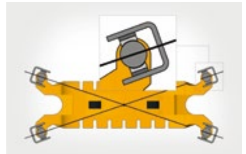
La guía térmicamente neutra del carro permite compensar las dilataciones horizontales generadas por la fluctuación de la temperatura.