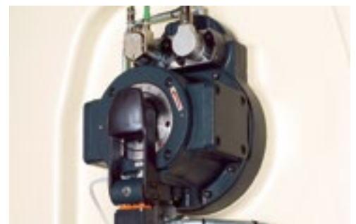
Mayor flexibilidad gracias al cambio de carrera rápido.